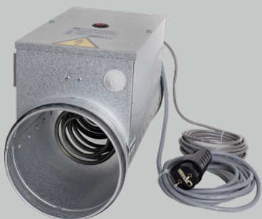
Modulerende varmeblade – med fabriksmonteret signalkabel og 230 volts stik

Den elektriske kanalvarmeblade kan anvendes i ventilationsanlæg, hvor der er behov for ekstra varme i form af forvarme eller eftervarme. Varmebladen fås med Ø125, Ø160, Ø200 eller Ø250 mm kanaltilslutninger. Varmebladen leveres enten som on/off udgave (tilpasset alle Genvex Optima styringer) eller som modulerende (tilpasset Optima 251, Optima 260 og Optima 312). Ø125 varmebladen kan valgfrit konfigureres til en varmeydelse fra 300,600 eller 900 watt. Ø160, Ø200 og Ø250 kan valgfrit konfigureres i trin på 300 watt fra 300 til 1800 watt.