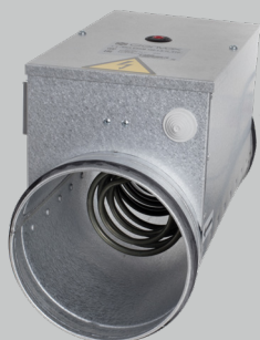
On/off varmeblade – uden fabriksmonterede ledninger