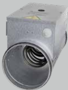
On/off varmeblade – uden fabriksmonterede ledninger