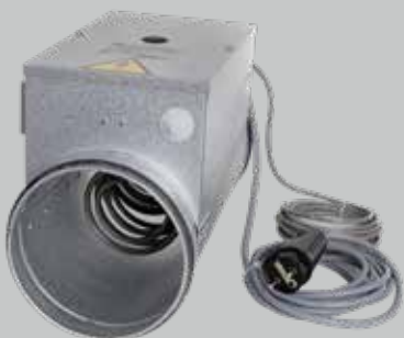
Modulerende varmeblade – med fabriksmonteret signalkabel og 230 volts stik

Den elektriske kanalvarmeblade kan anvendes i ventilationsanlæg, hvor der er behov for ekstra varme i form af forvarme eller eftervarme. Varmebladen fås med Ø125, Ø160, Ø200 eller Ø250 mm kanaltilslutninger. Varmebladen leveres enten som on/off udgave (tilpasset alle Genvex Optima styringer) eller som modulerende (tilpasset Optima 251, Optima 260 og Optima 312). Ø125 varmebladen kan valgfrit konfigureres til en varmeydelse fra 300,600 eller 900 watt. Ø160, Ø200 og Ø250 kan valgfrit konfigureres i trin på 300 watt fra 300 til 1800 watt.